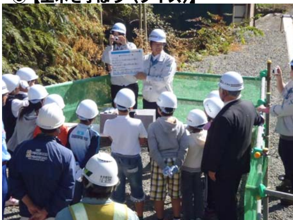
③【土木を学ぼう(クイズ)】