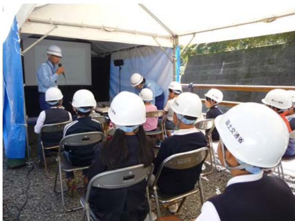
①【道路の工事や仕組みを学ぼう】