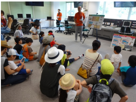
操作室にてダムの説明中