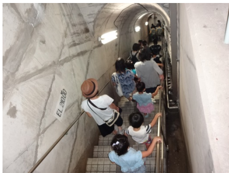
監査廊内を移動中