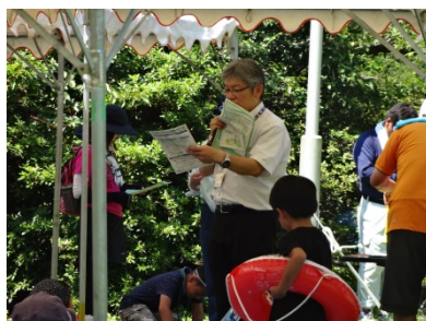
水難事故について