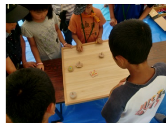
木工品作成（コマ大会）