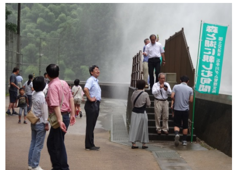
ダム直下にて放流見学