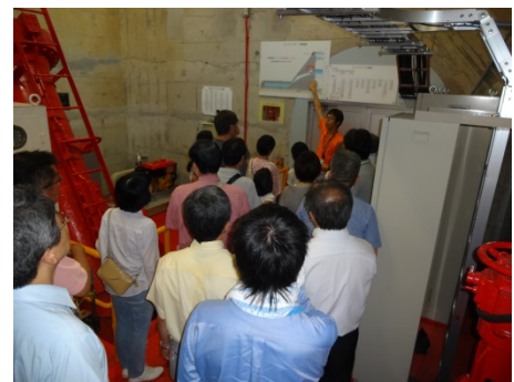
ダム堤体内で各ゲートの説明