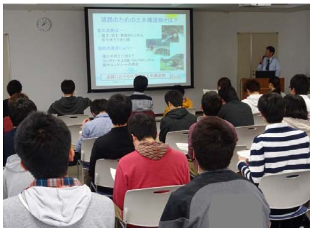
事務所内における概要説明