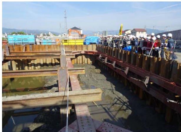
松山外環空港線 現場見学 （橋梁下部工の仮締切状況）