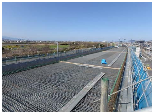
松山外環インター線 現場見学①