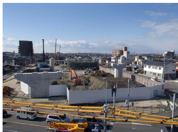
松山外環空港線 現場見学②