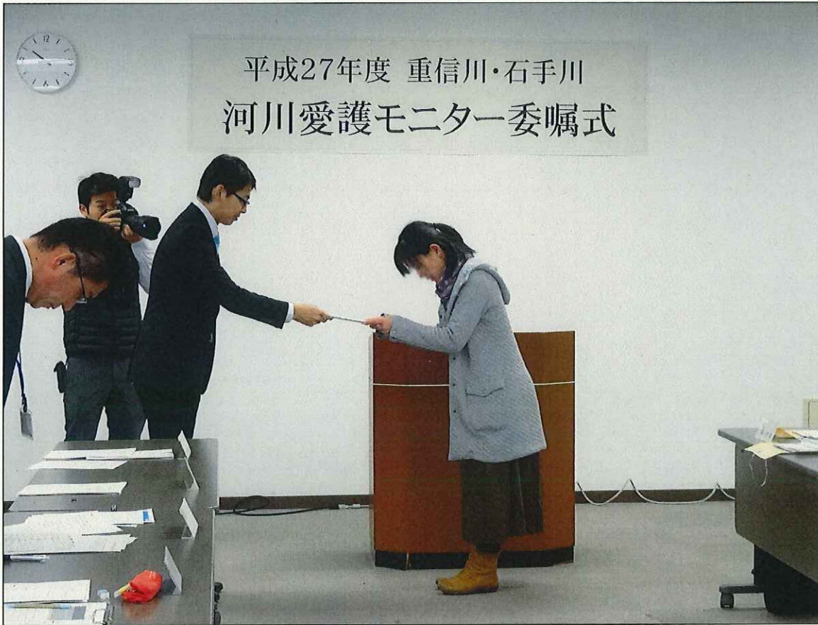
河川愛護モニター委嘱式