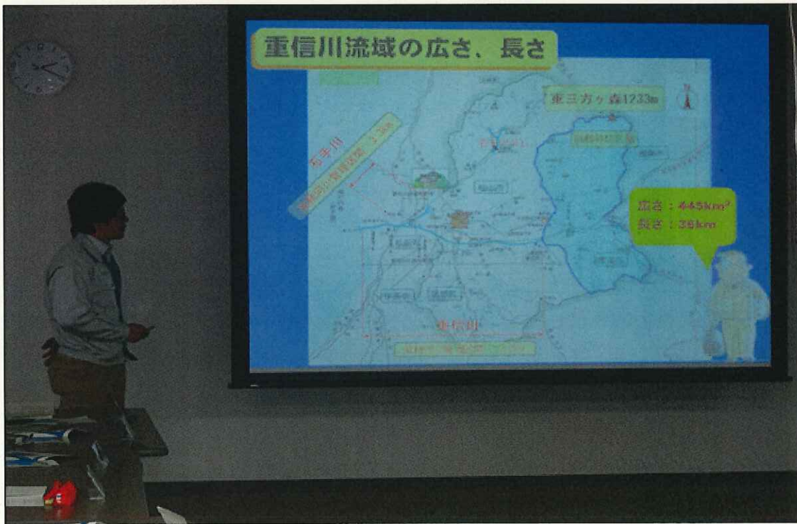
河川愛護モニター説明会