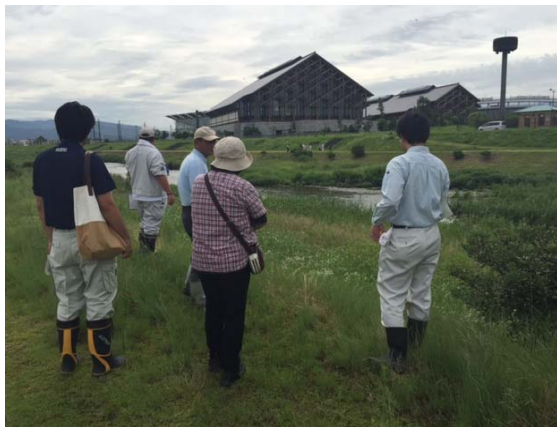
普段のモニター活動に加えて、職員とともに安全利用点検を行います。（年に2回程度）