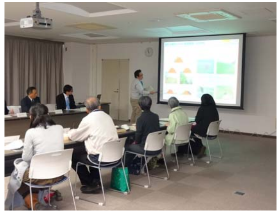
河川の概要やモニター心得についての説明を聞きます。