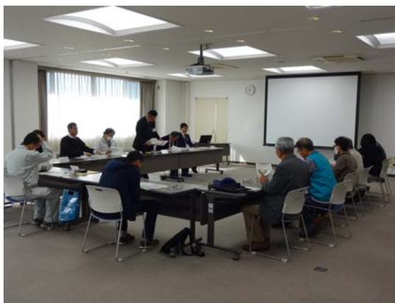
途中で意見交換会を行いますので、参加して気付いたことを遠慮なく話し合ってください。（年に1回）