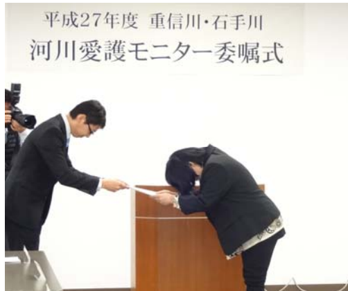
事務所長より委嘱状を受け取ります。