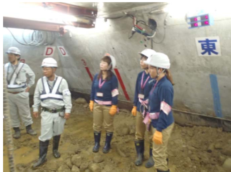
〈まどんなパトロール実施イメージ〉