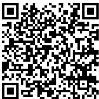
スマートフォン版 画面