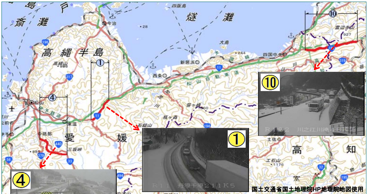
集中除雪区間(位置図)

同区間では、「大型車等の立ち往生が発生」、もしくは、「大規模な立ち往生の発生のおそれがある場合」には、県警察と連携のうえ、早い段階で通行止め措置を行い、除排雪作業及び立ち往生車両の移動を集中的に実施することにより、迅速に交通を確保するように努めているところです。