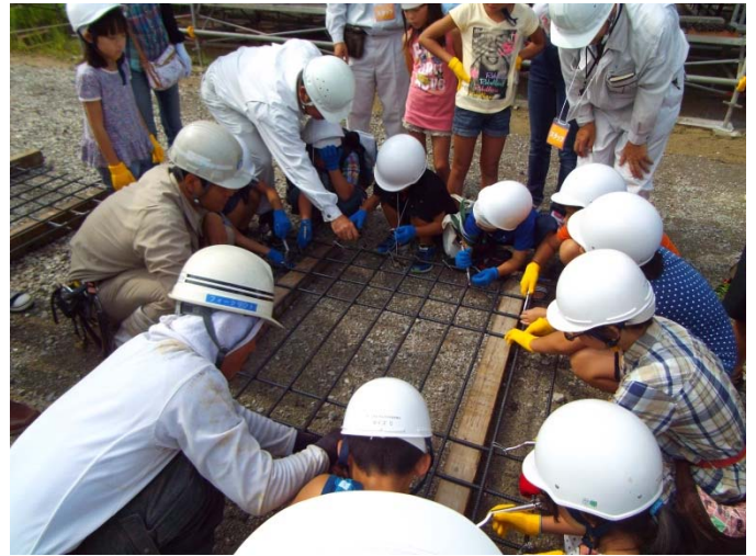
<鉄筋結束作業体験>