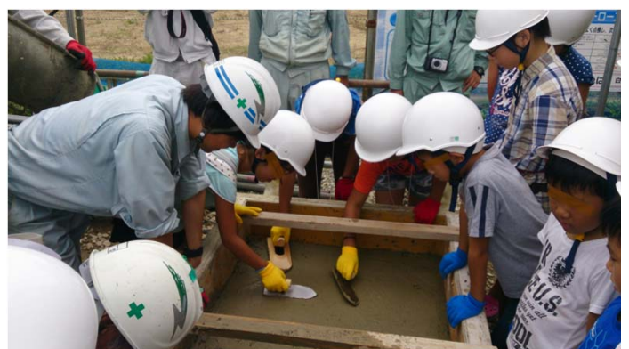
<コンクリート打設体験(コテ仕上げ)>