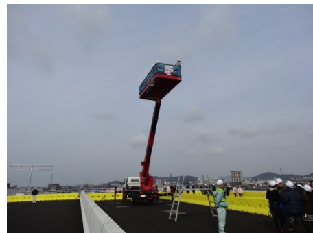
当日は、高所作業車にも体験試乗が出来ます。