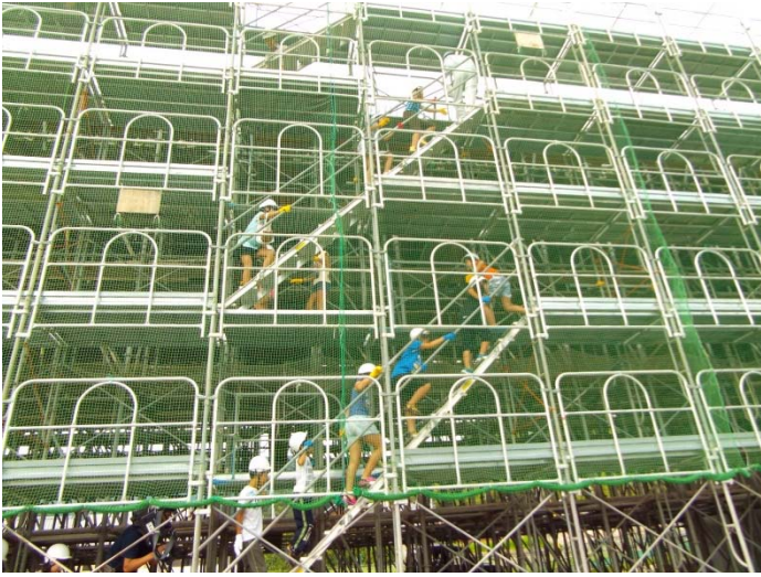
<工事足場の安全性を確認しつつ、橋の上に移動>