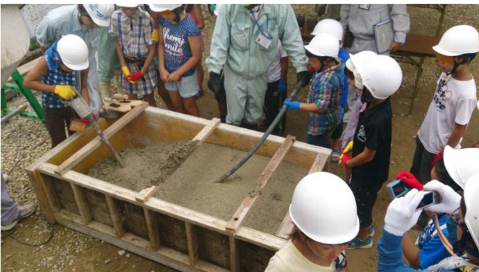
<コンクリート打設体験(充填中)>