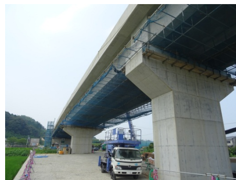
高架橋が着々と出来ています。