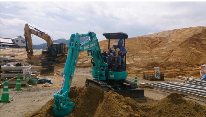
<建設機械の体験試乗>