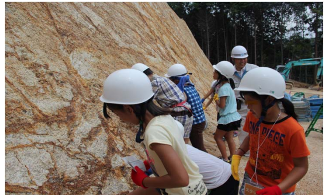
<切土面で土質の確認中>