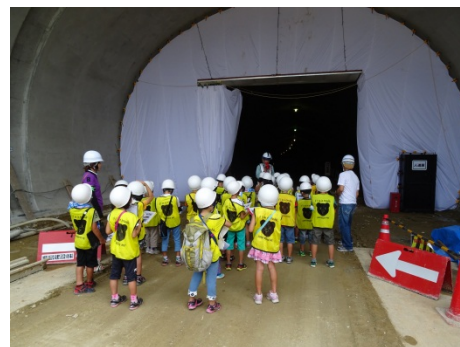
トンネルを通りぬけられます。