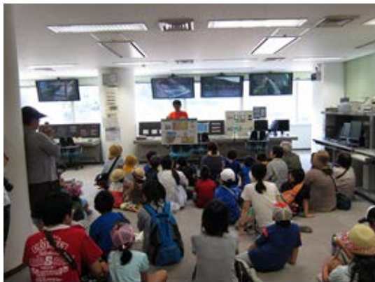
↑操作室でダム役割や仕組みの説明