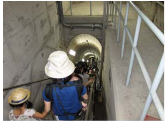
↑ダム堤体内の監査廊を移動