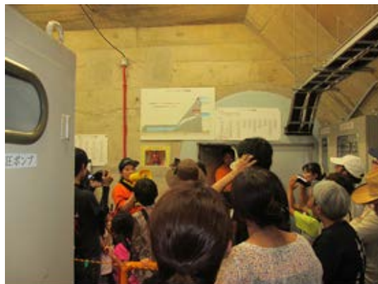
↑コンジットゲート室の見学 ダム堤体内