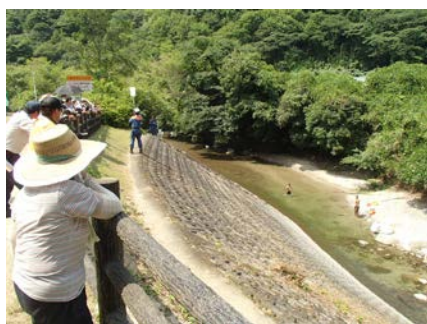
水難救助について