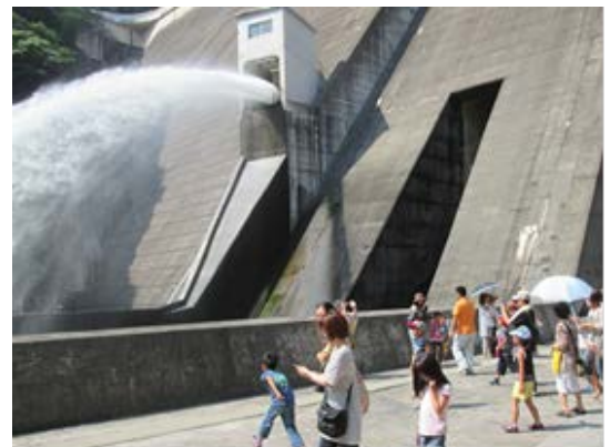
↑ホロージェットバルブからの放水の見学 ダム直下