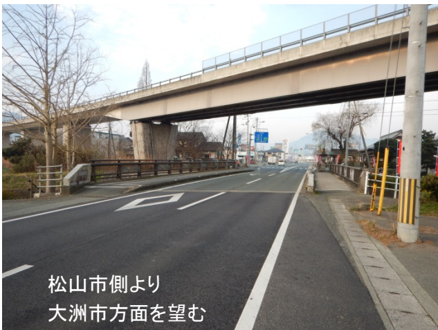
松山市側より 大洲市方面を望む