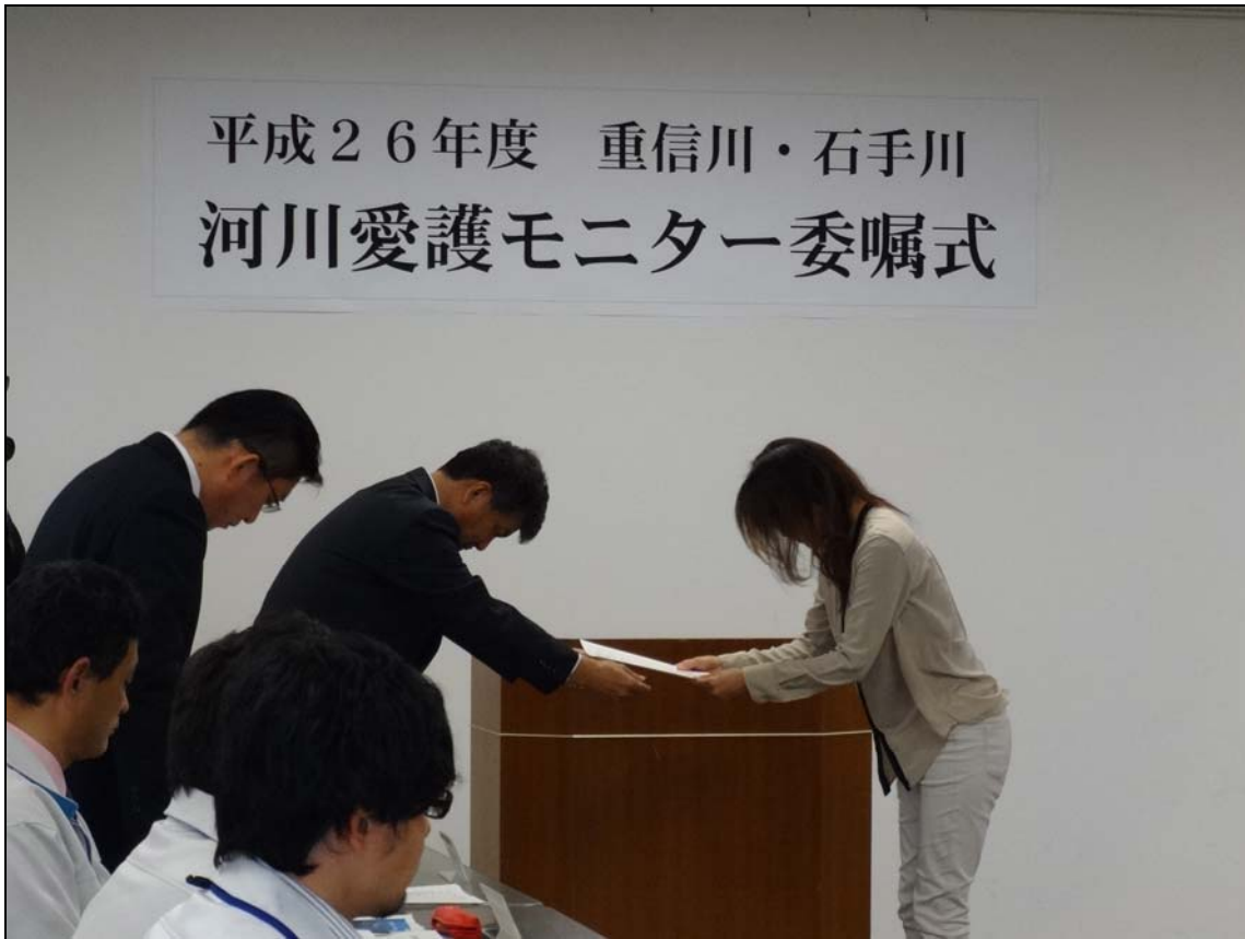
河川愛護モニター委嘱式