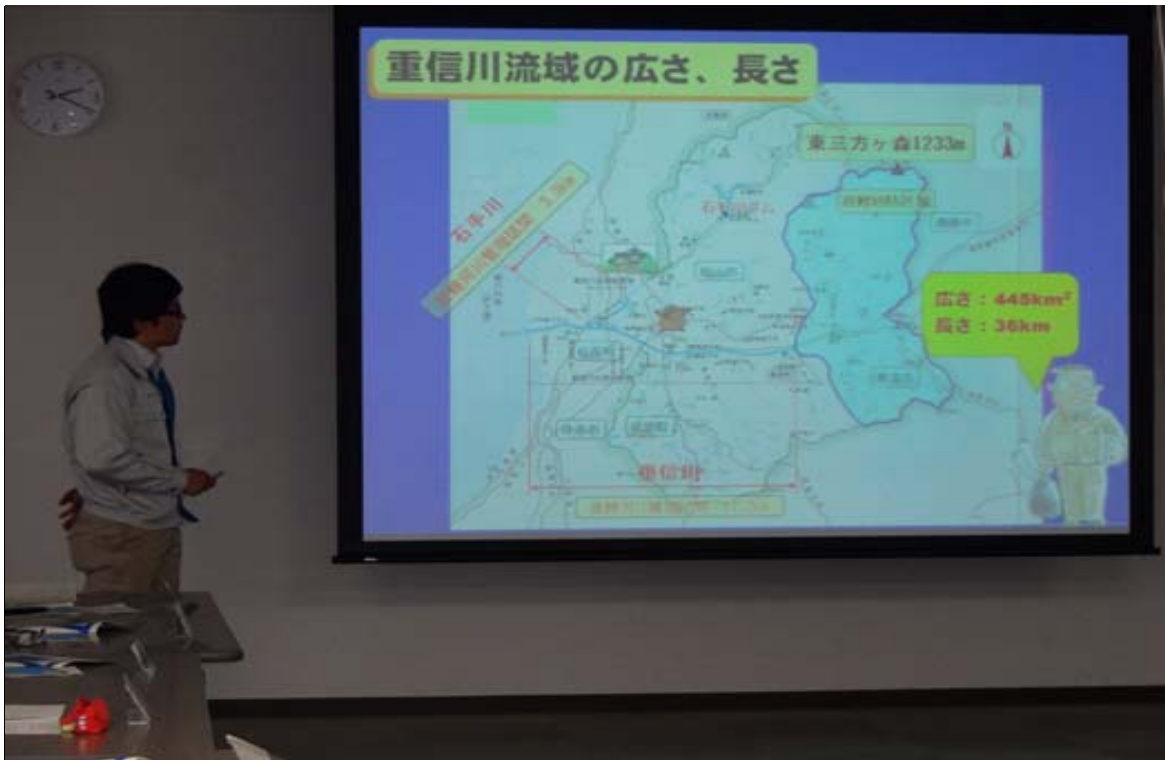
河川愛護モニター説明会