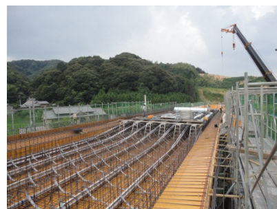
実は橋をつくっています。