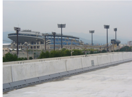
橋の上から、松山中央公園が眺望できます。