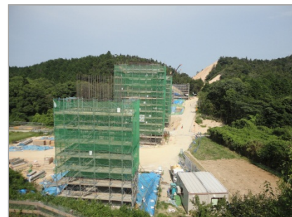
見るからに高い橋脚です