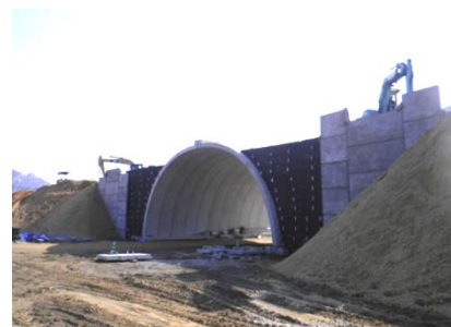
アーチカルバートタイプの道路ボックスです