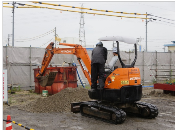
重機に体験試乗できます。