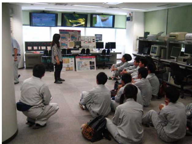
①石手川ダム操作室での説明