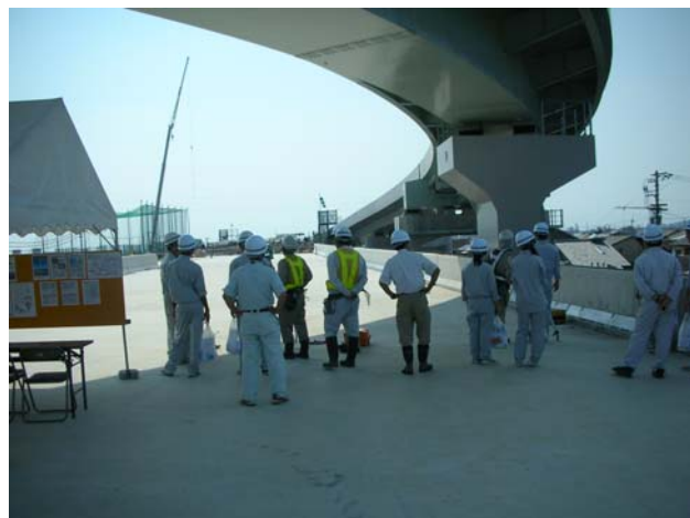
③松山外環状道路インター線現場