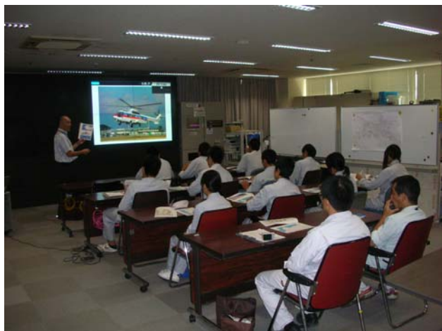
②事務所災害対策室での説明