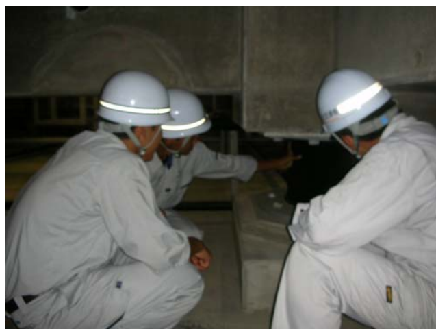
②事務所地下耐震対策