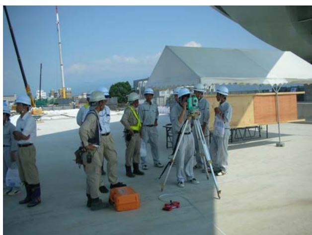
③松山外環状道路インター線現場測量体験