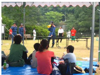
水難救助について