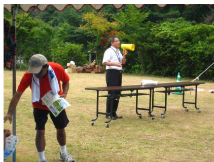
水難事故について