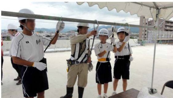
安全帯の使用方法説明