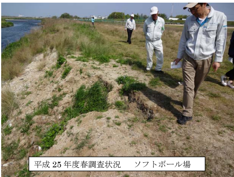
平成 25 年度春調査状況 ソフトボール場