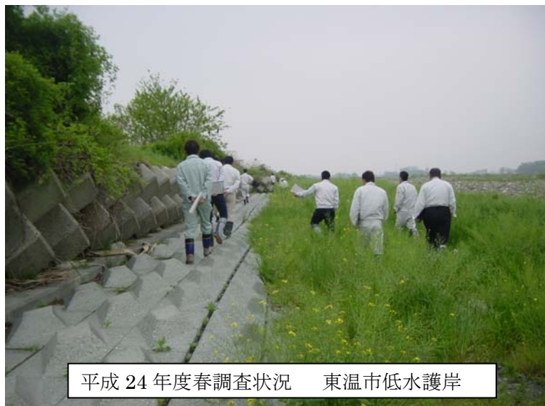
平成 24 年度春調査状況 東温市低水護岸