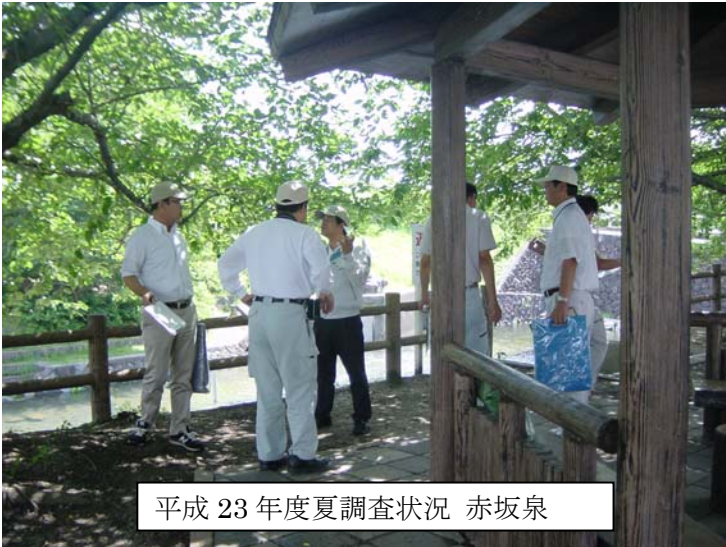
平成 23 年度夏調査状況 赤坂泉