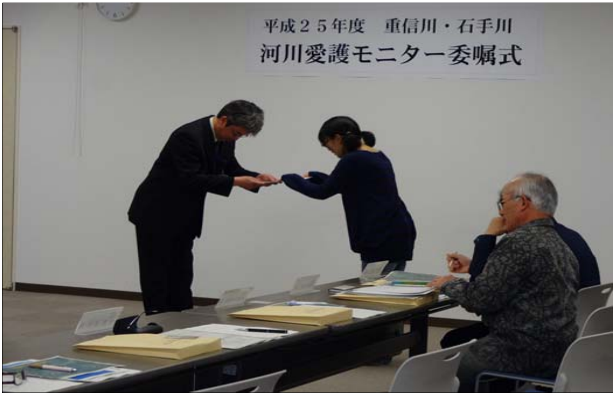
河川愛護モニター委嘱式