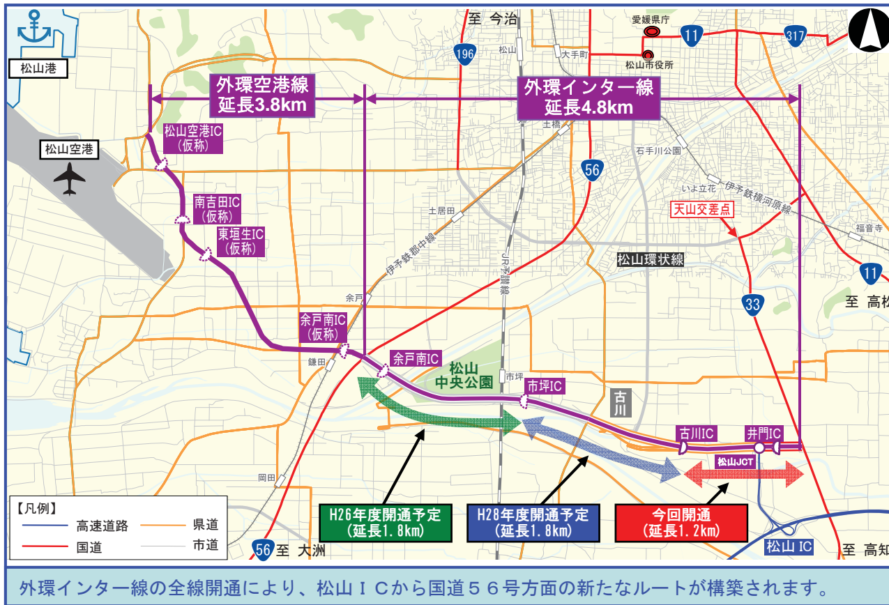
「外環インター線」今後の開通予定