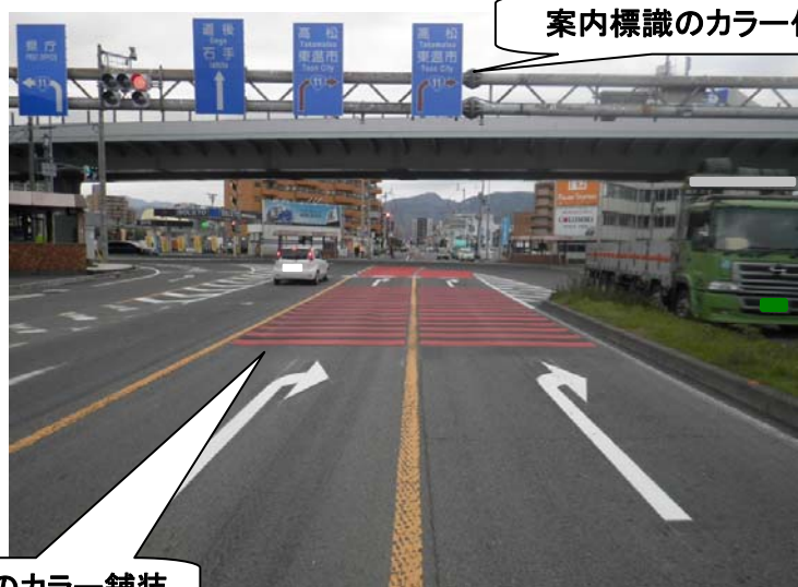
右折レーンのカラー舗装