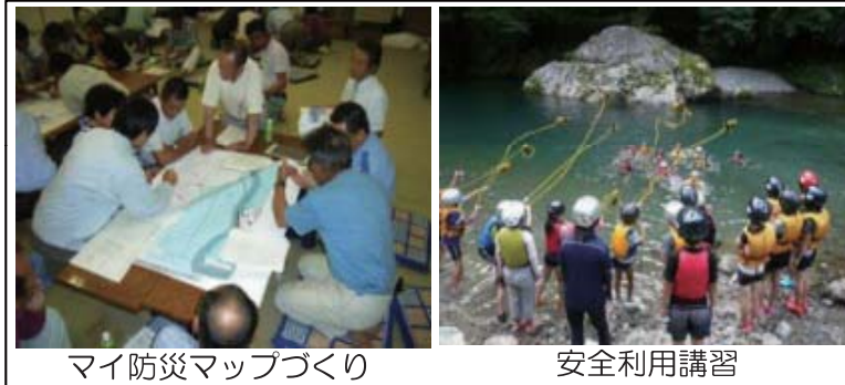
マイ防災マップづくり