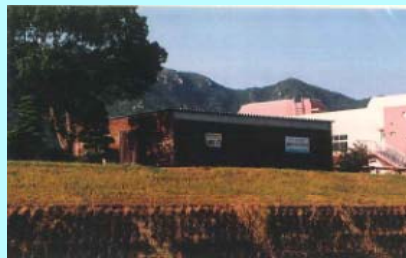
市民団体による活動拠点の整備事例（佐波川）

※ 河川管理者から河川管理施設の維持、除草等の委託を受けることも可能となります。委託先については、公募等の適正な手続きを経て選定を行う予定です。