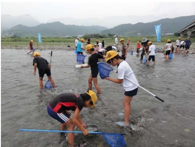
H24 拝志小学校実施状況 1