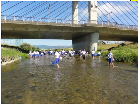
H24 椿中学校実施状況 1