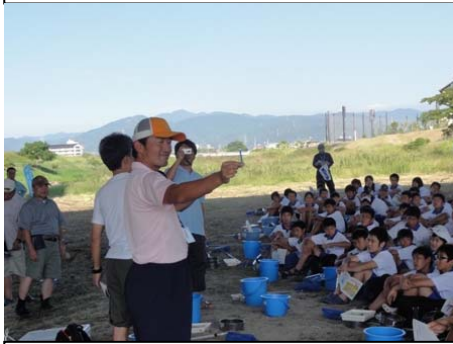
H24 椿中学校実施状況 2