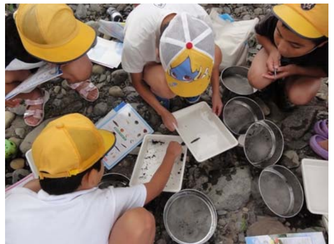
H24 拝志小学校実施状況 2