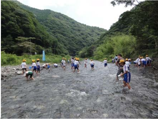
H24 さくら小学校実施状況 1