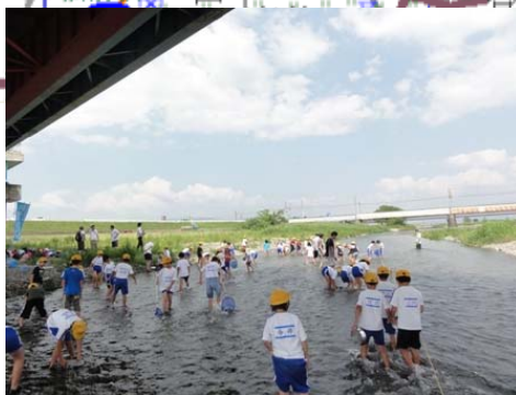
H24 さくら小学校実施状況 2