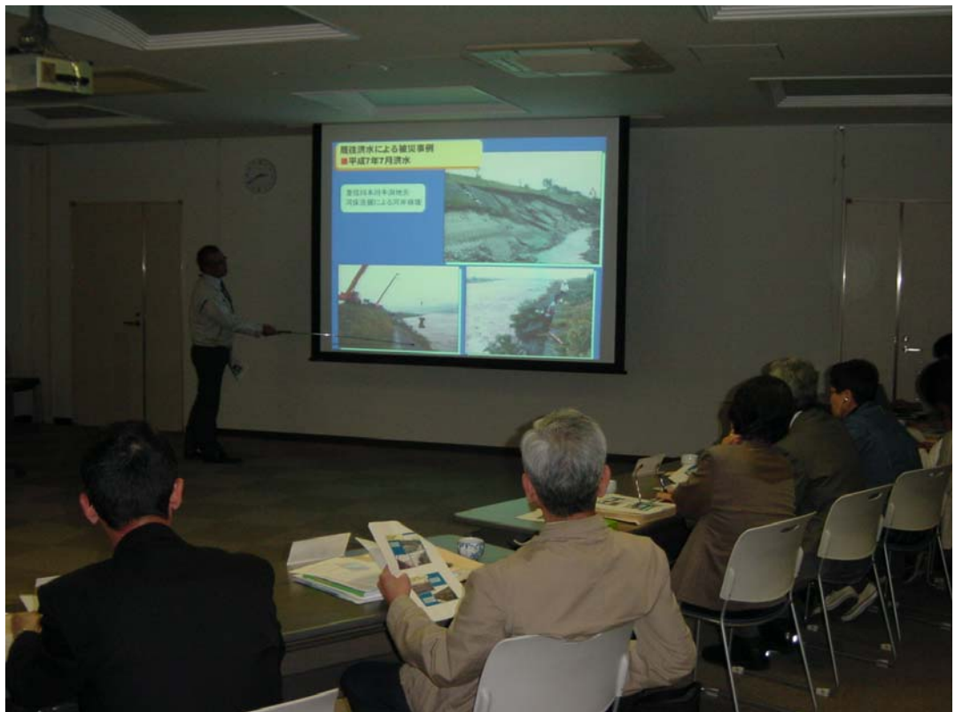
河川愛護モニタ一説明会