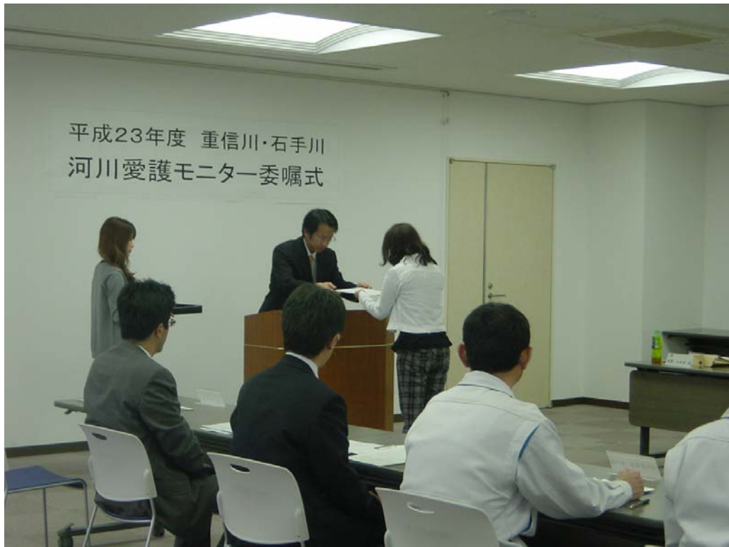
河川愛護モニタ一委嘱式