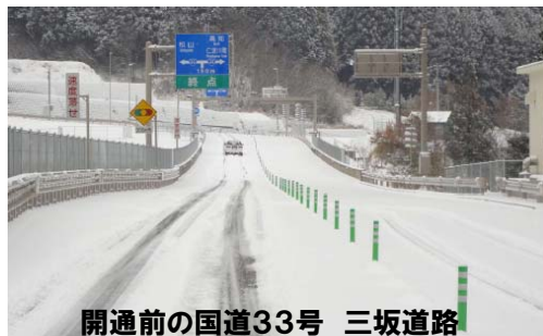
開通前の国道33号 三坂道路 (久万高原町東明神)