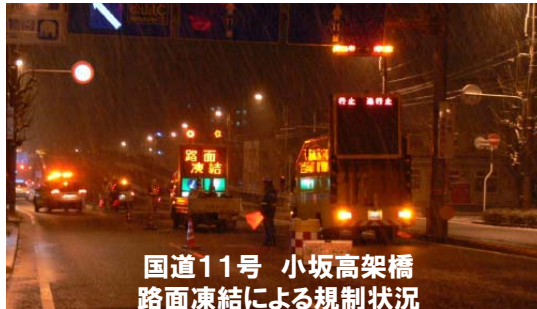
国道11号 小坂高架橋 路面凍結による規制状況 (松山市小坂5丁目付近)

◎携帯電話で四国の直轄国道の道路情報を取得できます。 『四国地区道路情報』をご利用下さい