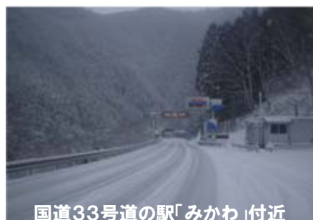
国道33号道の駅「みかわ」付近 (久万高原町中黒岩)