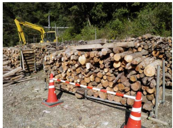
流木の仮置き状況(その他の写真は別紙3)