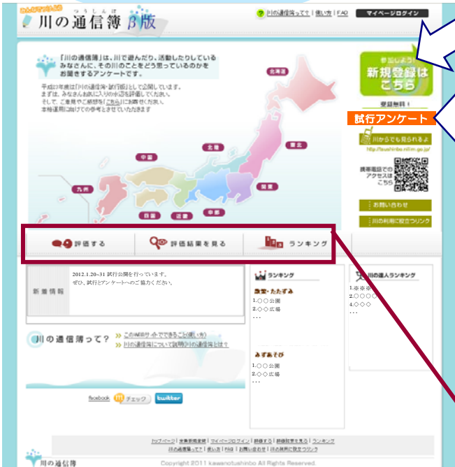
Web版「川の通信簿」TOPページ