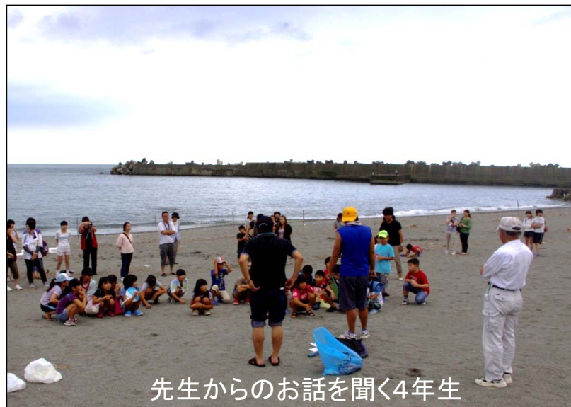
先生からのお話を聞く4年生

高知市立春野西小学校の4年生が、ふ化したアカウミガメを放流しました。高知海岸戸原工区で採卵保護の様子を見学してから約2ヶ月たち、小学校のふ化場で、子ガメがたくさん誕生しています。