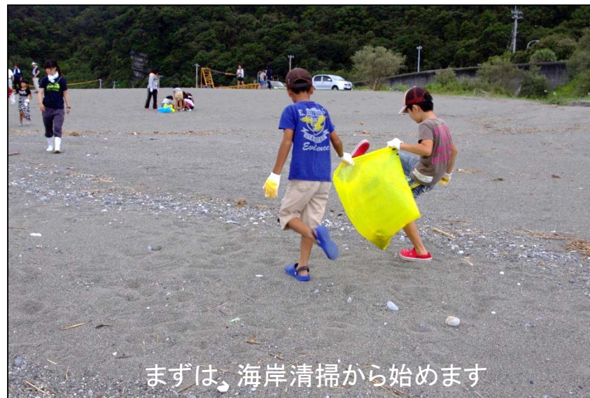
まずは、海岸清掃から始めます