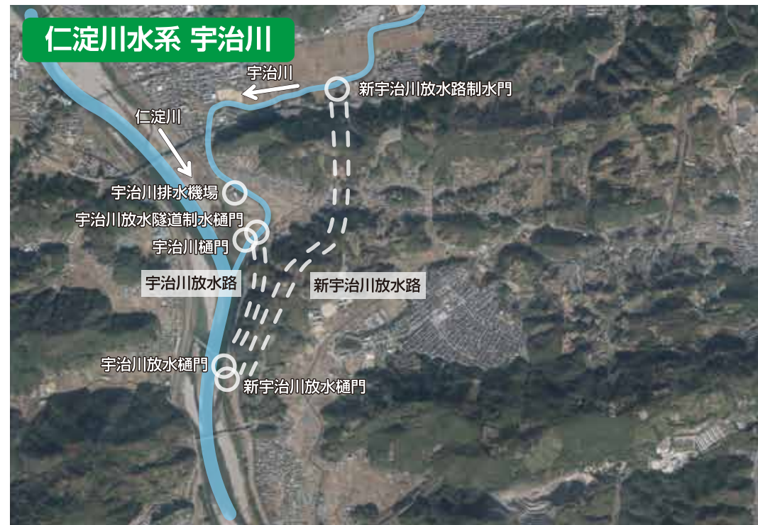
うじかわほうすいる 宇治川放水路