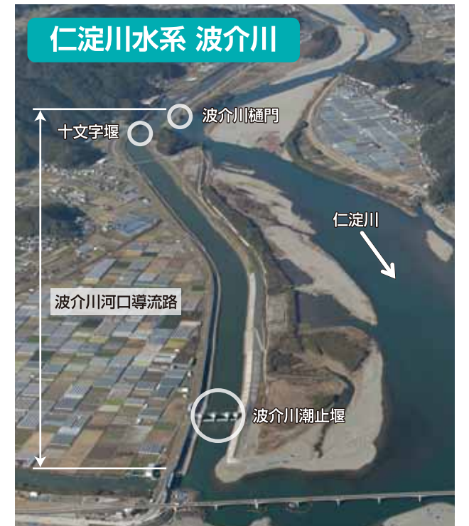
はげかわかこうどうりゅう 波介川河口導流路