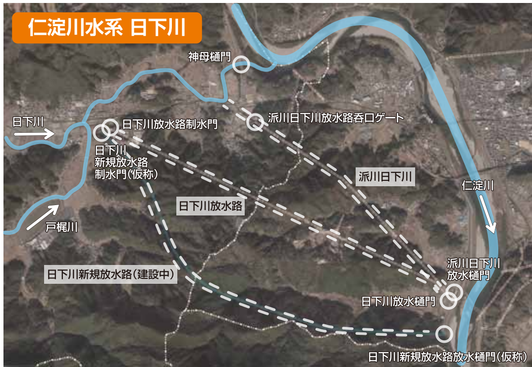
くさかわほうすいる 日下川放水路