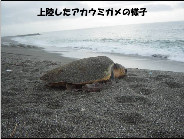
上陸したアカウミガメの様子