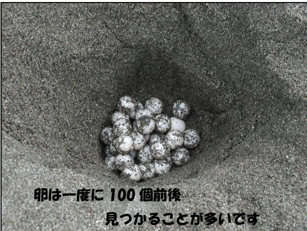
卵は一度に100個前後 見つかることが多いです