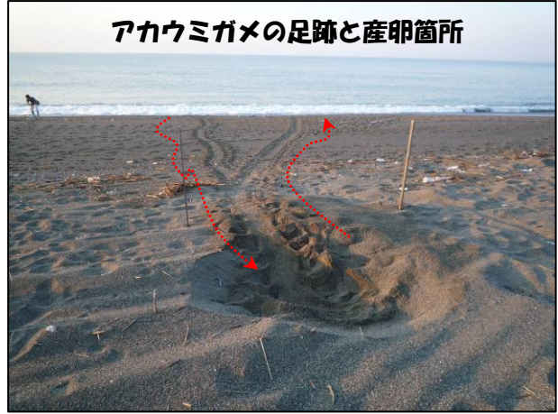
アカウミガメの足跡と産卵箇所