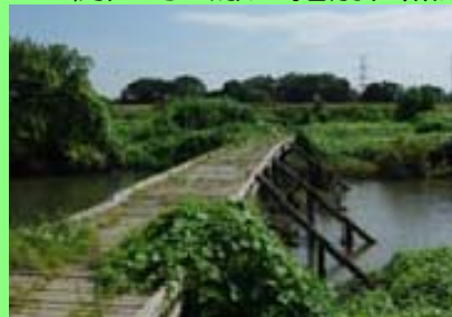
ピオトープの整備