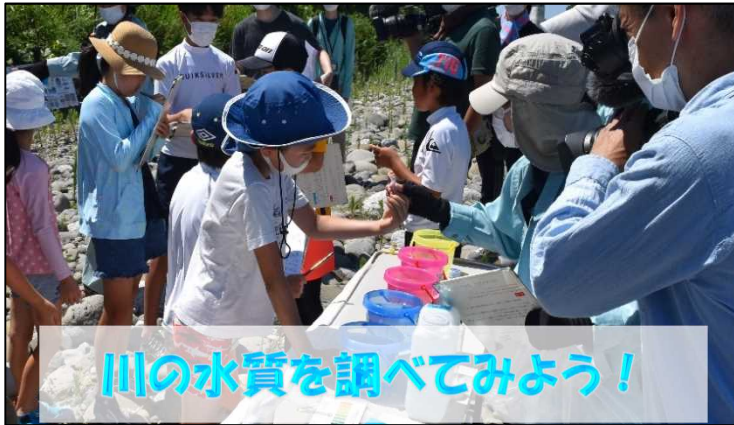
川の水質を調べてみよう!