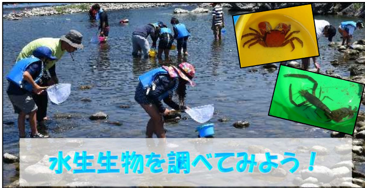
水生生物を調べてみよう!