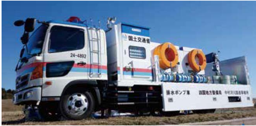
ポンプ車（高知河川国道事務所）