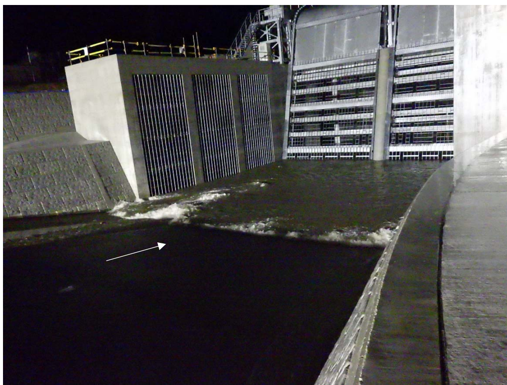
新日下川放水路 (呑口部)