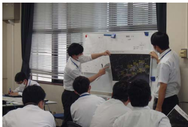
【検討結果の発表および意見交換】