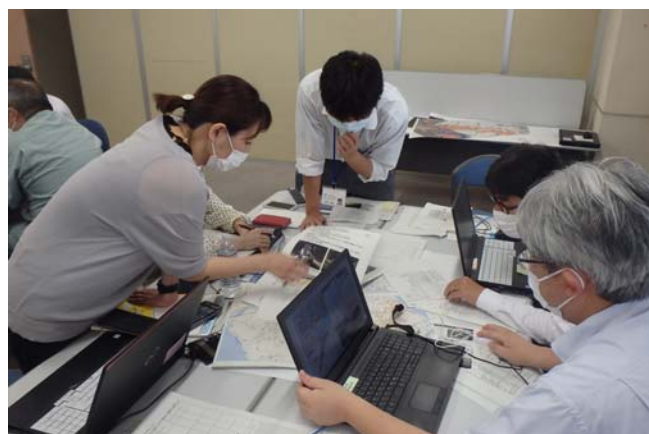
【情報提供の内容確認】