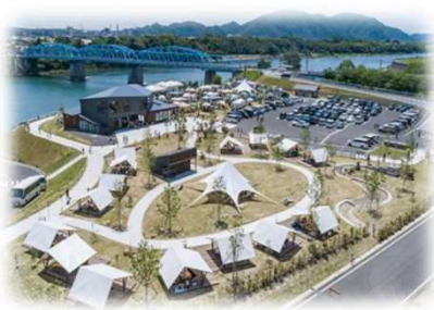
賑わい拠点の整備 (木曾川 / 美濃加茂市)