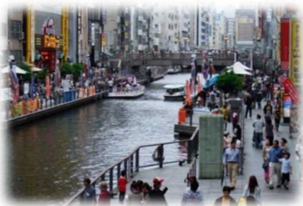
遊歩道の民間活用 (道頓堀川 / 大阪市)