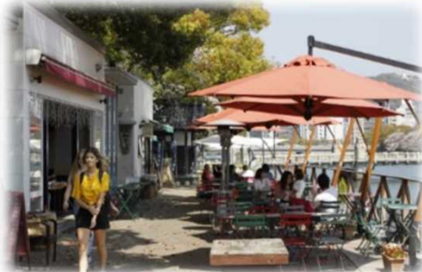
オープンカフェの設置 (京橋川 / 広島市)