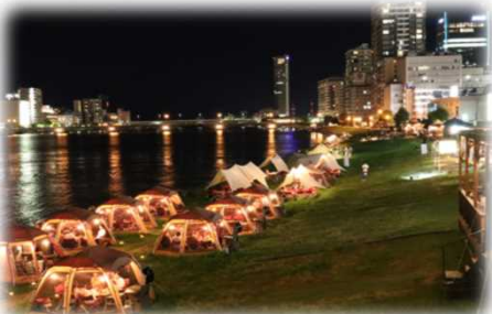
民間事業者の参加 (信濃川 / 新潟市)