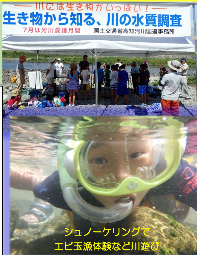
シュノーケリングでエビ玉漁体験など川遊び