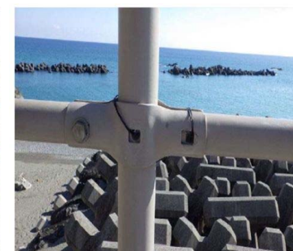
結束バンドによる応急処置状況