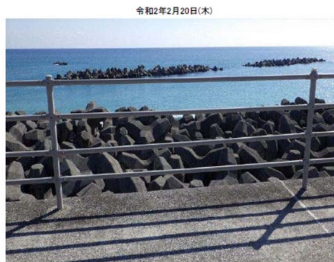
1.仁ノ工区 30/0+25~30/6+170 ガードパイプ固定ボルトの欠損状況(1)