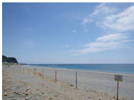
車両進入防止対策（仁ノ工区）