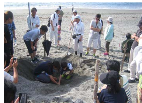
採卵保護見学会を実施(春野漁港)

★海岸美化活動・自然環境保護の取り組みは、高知河川国道事務所HPの高知海岸情報ステーションで紹介しています。