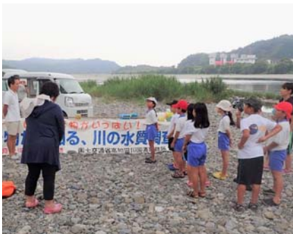
（H29年度水生生物調査実施状況）

物部川での水生生物調査は7月下旬を予定しており、実施時期・内容が決まり次第、改めてご案内致します。