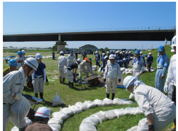
漏水対策 (月の輪工)