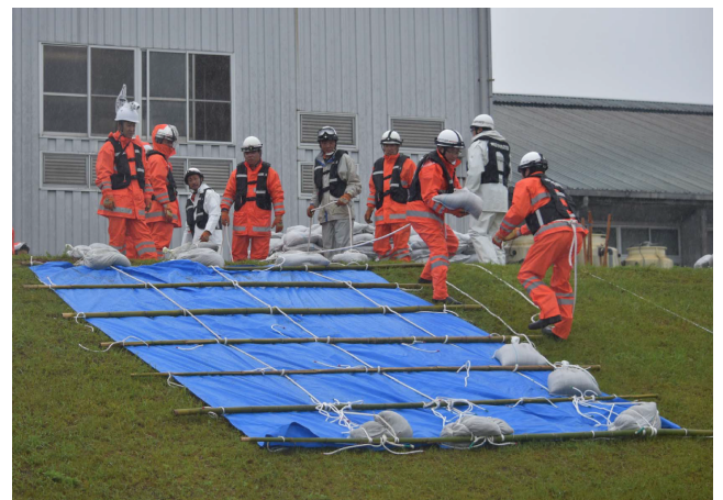
洗掘対策 (シート張工)