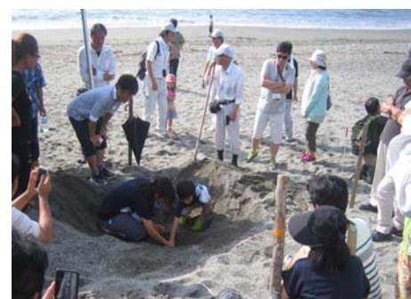
採卵保護見学会を実施(春野漁港)

★海岸美化活動・自然環境保護の取り組みは、高知河川国道事務所HPの高知海岸情報ステーションで紹介しています。