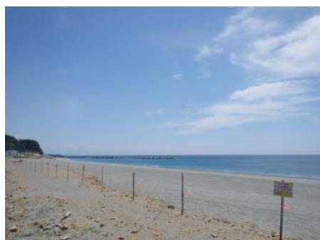
車両進入防止対策 (仁ノ工区)