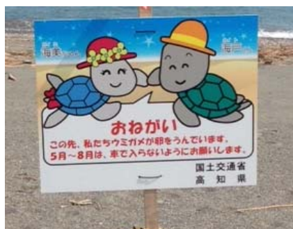
看板にて啓発(仁ノ工区)