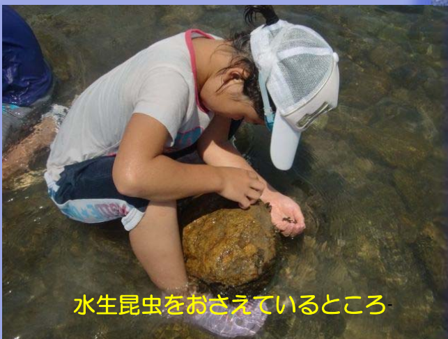
水生昆虫をおさえているところ