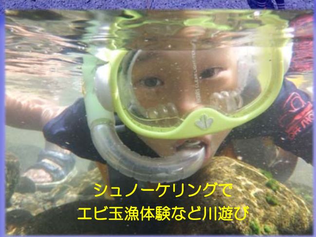
シュノーケリングで エビ玉漁体験など川遊び