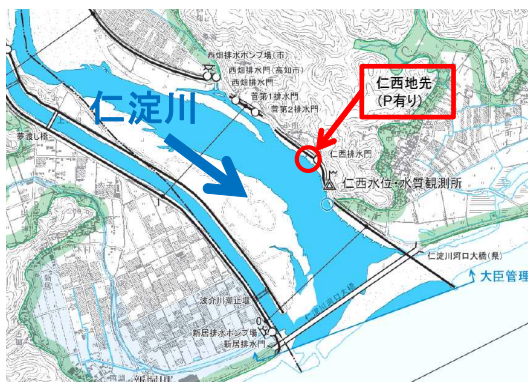
この地図は、国土地理院長の承認を得て、電子地形図25000を複製したものである。（承認番号 平成27情複、第502号）