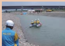
県警ボートによる 孤立者救助