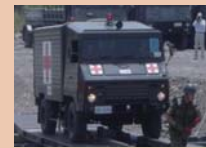
被災者搬送訓練 (陸自・南国消防・香南消防)