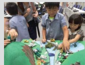
働く車のトミカ(ツトマ)