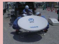
通信応急復旧訓練