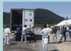
救援物資輸送訓練