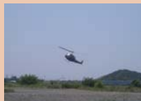
陸自ヘリコプターによる 孤立者救助