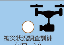
被災状況調査訓練(ドローン)