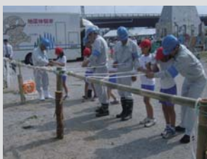
ロープワーク体験