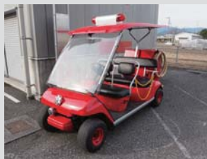
南国市ミニ消防ポンプ車 「ポンパーくん」