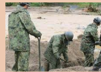
土砂災害等救出訓練 (陸自・県警)