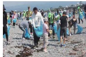
海岸環境の維持 (清掃活動)