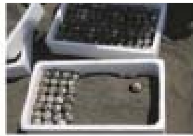
希少種保護 (ウミガメ卵の保護)