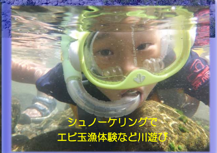
シュノーケリングでエビ玉漁体験など川遊び