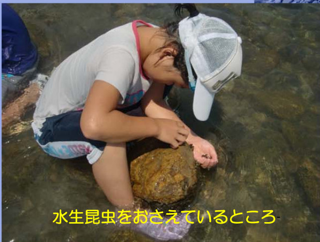
水生昆虫をおさえているところ