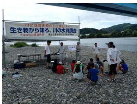
(H28年度水生生物調査実施状況)

*雨天及び増水の場合は延期します。(延期日は9/7(木)高石小学校9:30～12:00を予定)