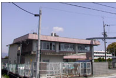
物部川出張所 〒783-0091 南国市立田古番所1347-1 TEL (088) 863-2720