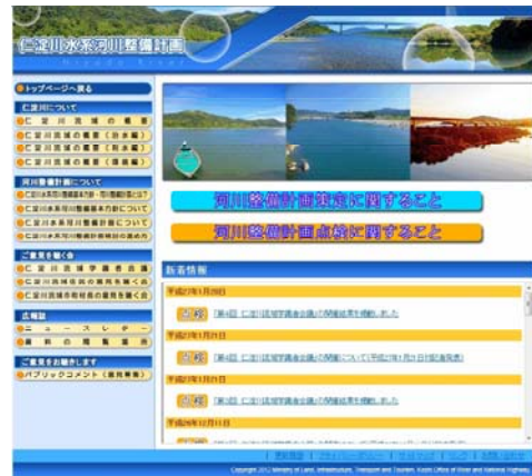
仁淀川水系河川整備計画のホームページトップ画面

http://www.skr.mlit.go.jp/kochi/niyodoseibikeikaku/