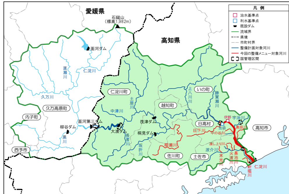
仁淀川水系河川整備計画の対象区間

仁淀川水系河川整備基本方針(平成20年3月策定)に基づき、仁淀川の総合的な管理ができるよう河川整備の目標及び実施に関する事項を定めるものです。その対象期間は、概ね30年としています。