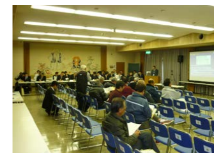
「第1回仁淀川流域住民の意見を聴く会」 平成25年1月26日、27日