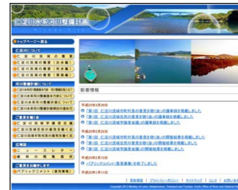
仁淀川水系河川整備計画のホームページトップ画面

http://www.skr.mlit.go.jp/kochi/niyodoseibikeikaku/