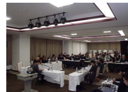
「第1回仁淀川流域学識者会議」 平成25年1月22日