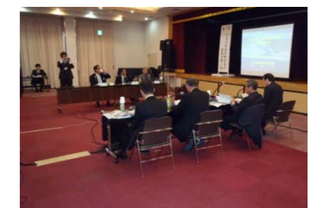
「第1回仁淀川流域市町村長の意見を聴く会」 平成25年2月7日