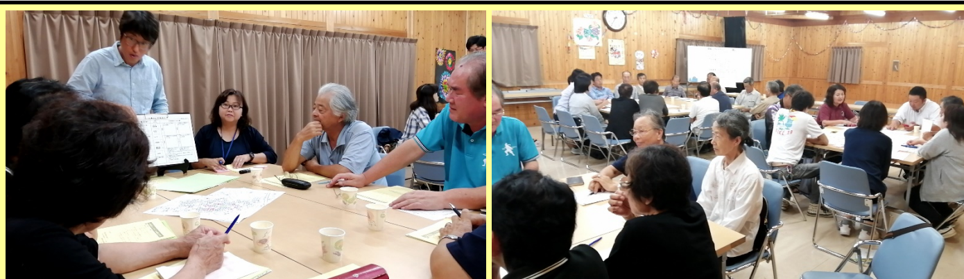
ネットワーク会議の様子